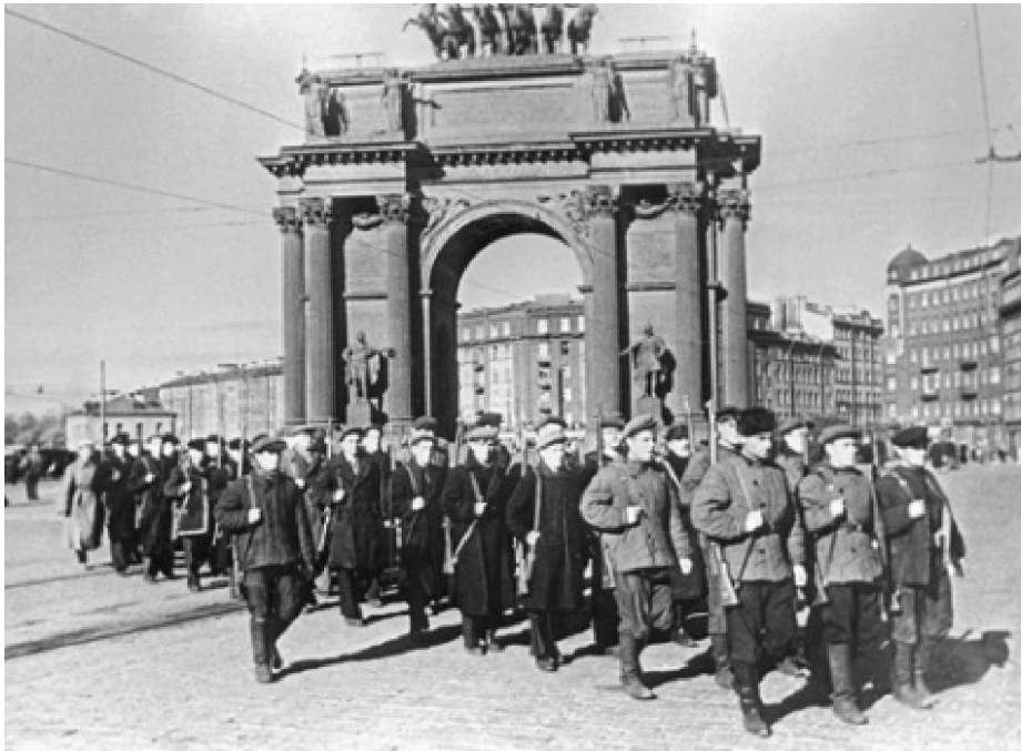
Рис. 1. Ленинград июль 1941 г. Первые добровольческие отряды на центральных улицах города

Отклик на зов был характерен: массовостью, свойственной для эпохи разгара строительства социализма; энтузиазмом, практически полным возрастным набором (записывались с 14 до 60 лет).